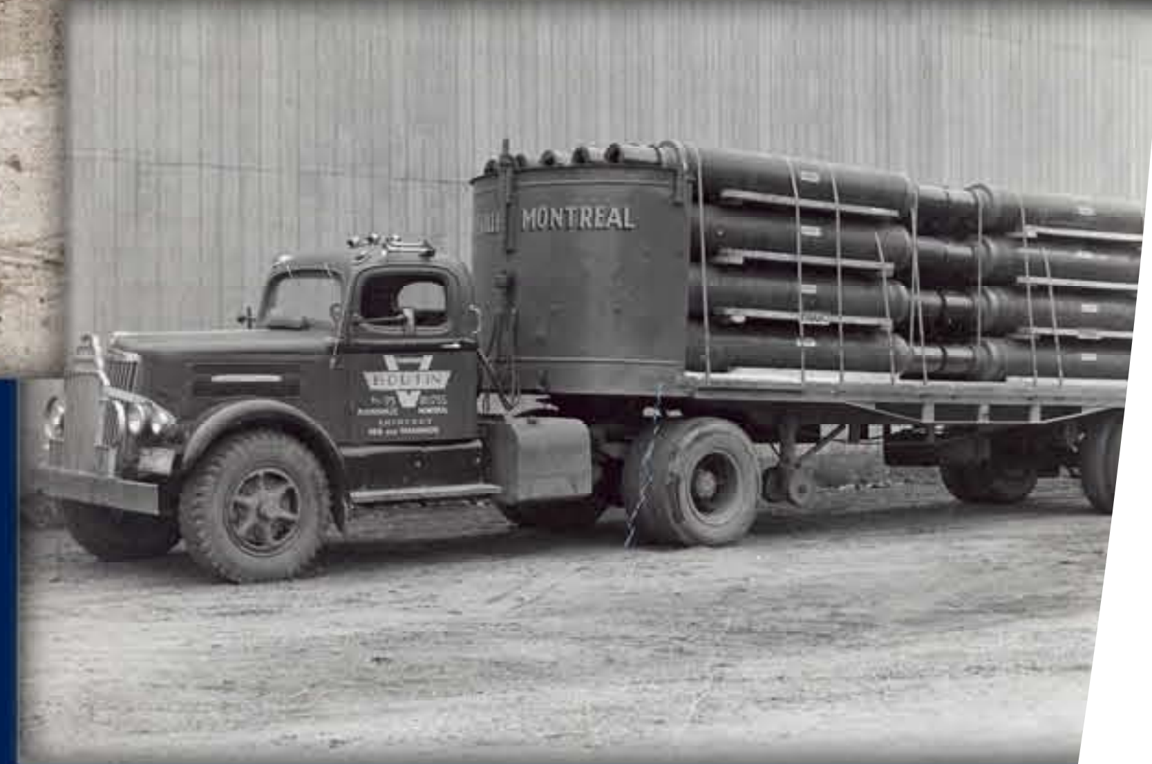
À droite : un des 1200 camions de marchandises qui empruntent cette route tous les jours depuis les années 1960 pour se rendre dans les grandes villes du continent nord-américain. Camion de Boutin Transport. • Famille Boutin